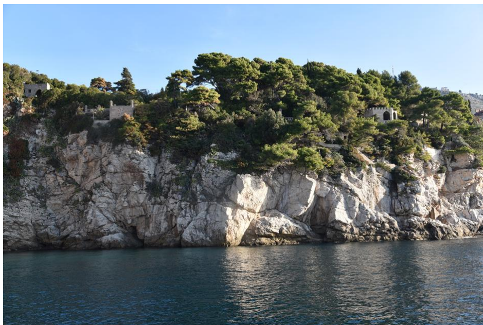
Slika 3. Pogled na perivoj Vile Čingrija s mora