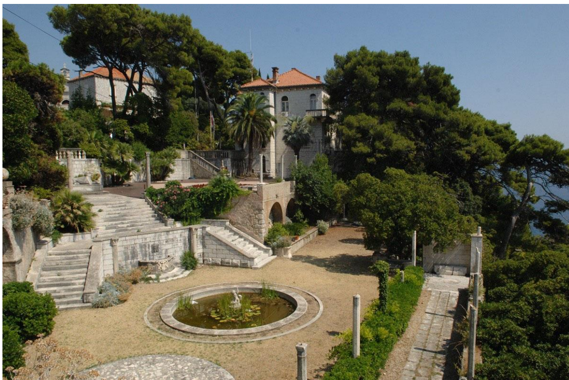
Slika 7. Recentno stanje perivoja i vegetacije Vile Čingrija, foto: Marić, M.

U pogledu vegetacijskog fonda, mahom se radi o autohtonoj vegetaciji te o prostoru u kojem nije zabilježena velika raznolikost vrsta (Marić et al., 2019). Tijekom vremena su sve zahtjevnije vrste za održavanje nestale. U najvećoj mjeri je prisutna vrsta Pittosporum tobira (Thunb.) W.T.Aiton (29,54 %), zatim Chamaerops humilis L. (28,5 %), Laurus nobilis L. (10,35 %), Pinus halepensis Mill. (5,56 %), Pinus pinaster Aiton (5,56 %), Phoenix canariensis Chabaud (4,04 %), Agave americana L. (3,28 %), Trachycarpus fortunei (Hook.) H.Wendl. (2,53 %), Cupressus sempervirens f. horizontalis (Mill.) Voss (2,27 %), Viburnum tinus L. (1,52 %), Nerium oleander L. (1,52 %), Yucca gloriosa L. (1,01 %), Opuntia ficus-indica (L.) Mill. (1,01 %), Yucca filamentosa L. (0,25 %), Ceratonia siliqua L. (0,25 %), Olea europea L. (0,25 %), Washingtonia robusta H.Wendl. (0,25 %), Phoenix dactylifera L. (0,25 %), Callistemon citrinus (Curtis) Skeels (0,25 %), Cupressus sempervirens var. pyramidalis (O.Targ.Tozz.) Nyman (0,25 %), Pistacia lentiscus L. (0,25 %), Viburnum lucidum Mill. (0,25 %) te Quercus ilex L. (0,25 %).