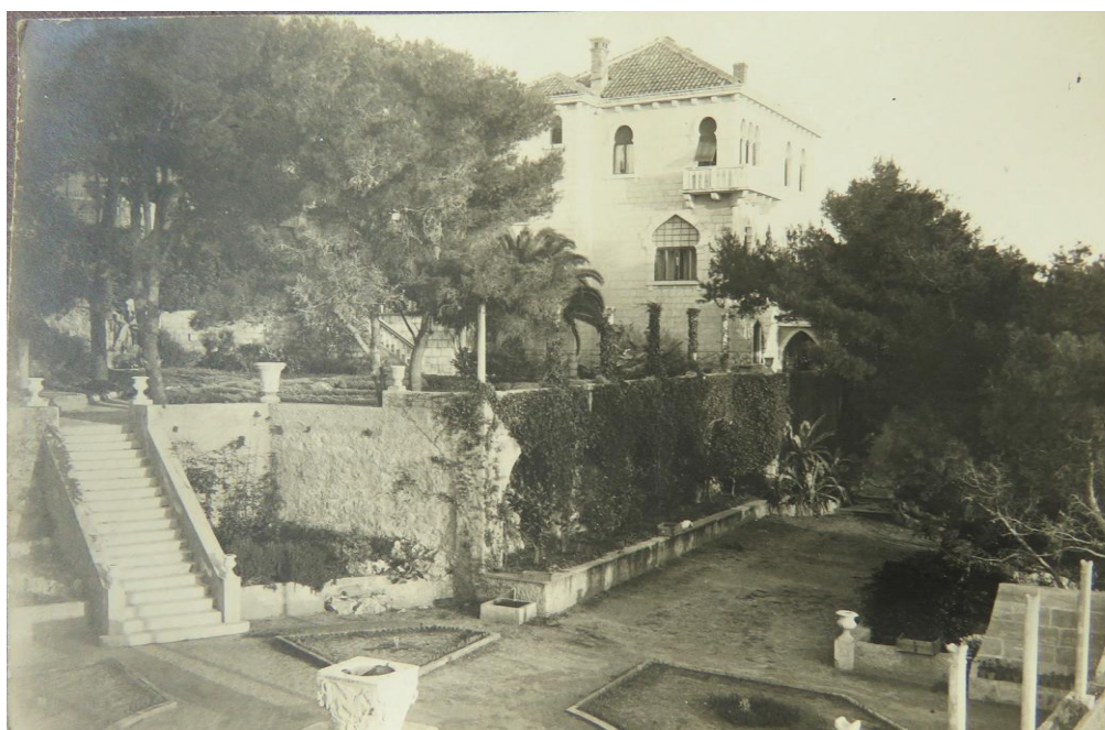
Slika 4. Fotografija I. faze vrta - središnja terasa (zapadna fasada)

Temeljem analize povijesnih fotografija (slike 4., 5., 6.) uočljiv je pristup oblikovanja vrtova karakterističan za početak 20. stoljeća (tzv. edvardijanski vrtovi) i niz povezanih intimnih, manjih vrtnih prostora geometrijski oblikovanih koji su "omekšani" biljkama, ograđeni formalnim živicama pitospora i šimšira ( Pittosporum tobira (Thunb.) W.T.Aiton, Buxus sempervirens L.), biljkama penjačicama koje prekrivaju zidove - lozica, bršljan, jasmin, ruže ( Parthenocissus sp., Hedera helix L., Jasminum sp., Rosa spp.), biljkama pokrivačima tla koje "omekšavaju" rubove staza poput veprine i hoste ( Ruscus sp., Hosta sp.). U parternim gredicama i velikim kamenim posudama su prema povijesnim fotografijama bile sađene egzote poput mediteranske palme ( Chamaerops humilis L.), agave ( Agave sp.), aloje ( Aloe sp.), kanarske palme ( Phoenix canariensis Chabaud), juke ( Yucca sp.) te druge tradicionalne vrste poput trajnica i ruža koje su posebno bile moderne u to vrijeme.