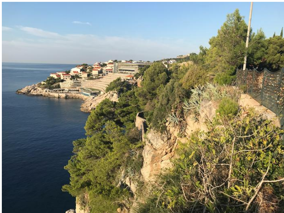
Slika 2. Pogled s Boninova prema litici i dijelu perivoja vile Čingrija

Urbana preobrazba poteza Boninova, uslijedila je proširenjem tzv. puta za Gruž za potrebe uvođenja električnog tramvaja 1910. godine, kojim se povezuje povijesna jezgra s predjelom Gruž. Tada se na rub ceste prema litici, na području Boninovo, postavlja prepoznatljiva željezna ograda, tamnozeleno boje s motivom suncokreta, prema predlošcima secesijskih ograda Otta Wagnera koje je projektirao u austrijskoj prijestolnici (Kraševac i Žaja Vrbica, 2016) (Slika 2).