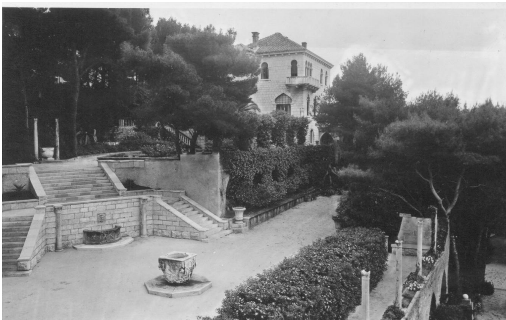
Slika 5. Izvorna fotografija II. faze vrta - središnja terasa (zapadna fasada)

(Državni arhiv u Dubrovniku, objavljeno u: Baće i Viđen, 2015)