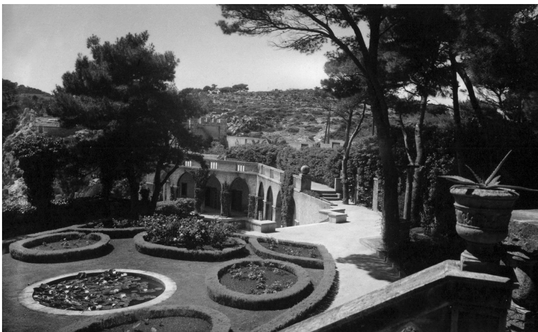
Slika 6. Fotografija II. faze vrta - pogled s ulaza prema zapadu