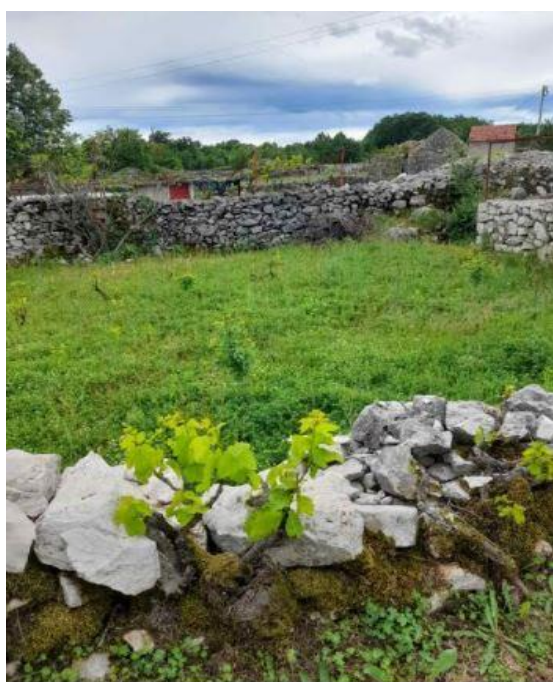
Slika 4. Suhozidovi u Hercegovini, element agrarnog krajobraza

Danas je u Dalmaciji i Hercegovini ostala poljoprivreda malih dimenzija, mješovitih domaćinstava, a proizvodnja služi za podmirenje vlastitih ili pak lokalnih potreba. Upravo ta "lokalna" obilježja bit će činilac opstanka i razvoja ovoga oblika proizvodnje. Jačanjem zadruga kao i državnim mjerama poticaja, potrebna je pomoć takvoj proizvodnji. Njena uloga je i održavanje tradicionalnog agrarni krajobraz (Slika 4) što će pridonijeti specifičnoj prepoznatljivosti područja (Defilipis, 2006).