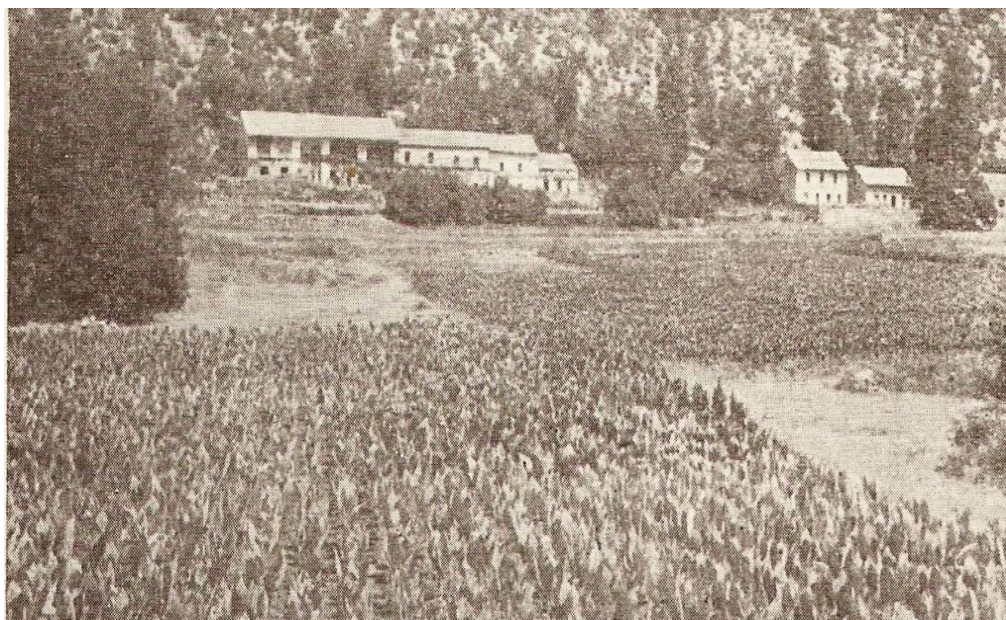
Slika 1. Uzgoj duhana u Klobuku (crvenica na dolomitu)

Depopulacija je najprije počela u naseljenim mjestima planinskog dijela Županije Zapadnohercegovačke iz razloga napuštanja tradicionalnih gospodarskih aktivnosti, u prvom redu poljoprivrede (uzgoj duhana i stočarstva). Duhan je bio stoljetni simbol i Hercegovine i njenog specifičnog tla, no danas rijetka su mjesta gdje se duhan uzgaja (Slika 1 i 2). Poneka domaćinstva to i danas čine, ali uglavnom u ograničenim količinama i može se slobodno kazati kako je ova kultura, koja je osiguravala životnu egzistenciju sveukupnog stanovništva, skoro u potpunosti nestala (Mikulić, 2013).