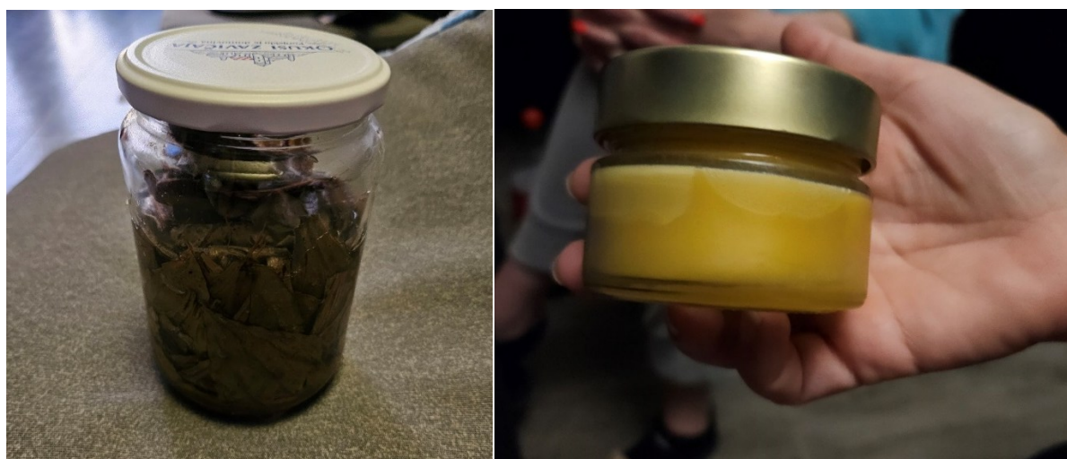
Slika 4. Sirup protiv kašlja od uskolisnog trputca ( Plantago lanceolata L.)