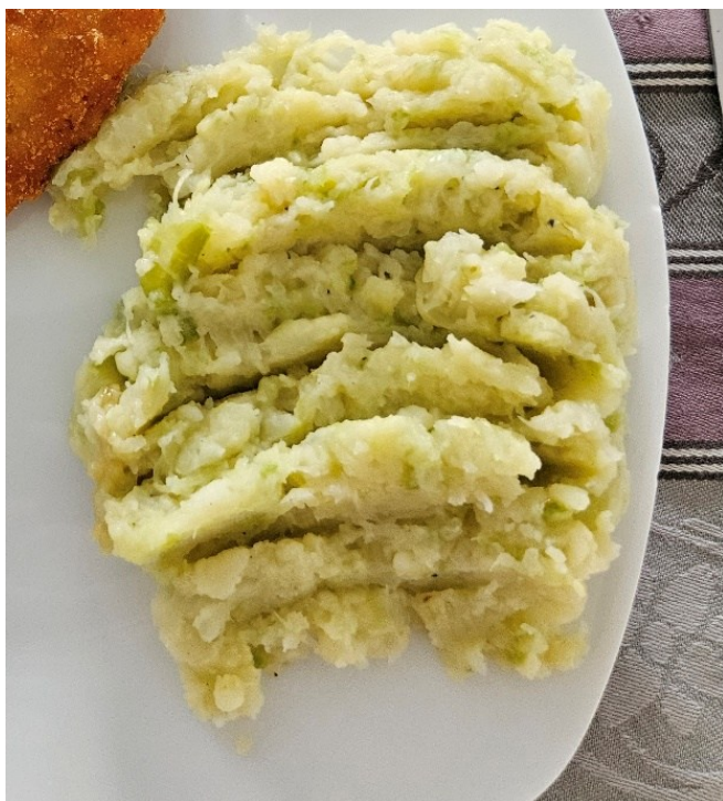
Slika 8. Čušpajz od zelja (kupusa) s kuhanim krumpirom