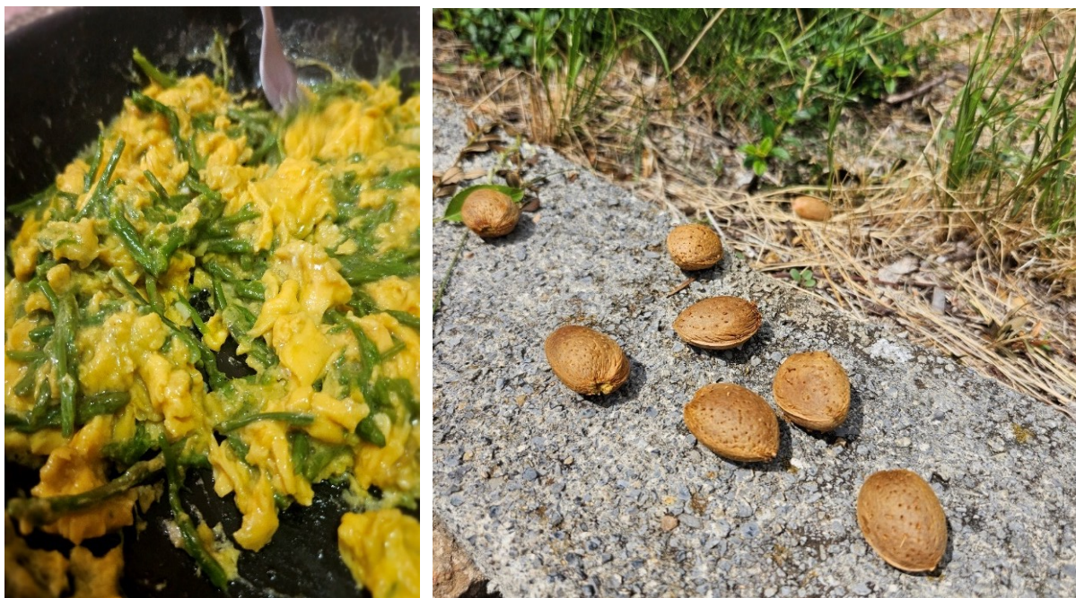
Slika 6. Kajgana (miješana) jaja s šparogama ( Asparagus acutifolius L.)

Sve intervjuirane osobe na području ruralne okolice Senja navode šparogu ( Asparagus acutifolius L.) kao ljekovitu biljku koja se najviše priprema kao kajgana (s mućkanim jajima) (slika 6), također se izdanci jedu i sirovi radi njihovog dijuretskog učinka.