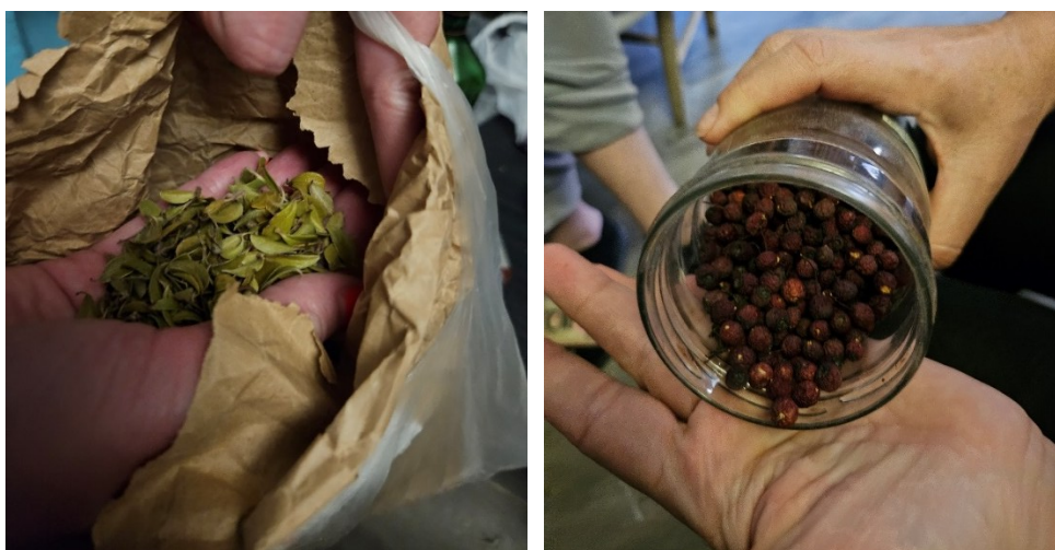
Slika 2. Sušeni listovi bejavice ( Arctostaphylos uva-ursi (L.) Spreng.) za čaj

Čaj od plodova gloga ( Crataegus monogyna L.) pije se za snižavanje visokog tlaka i za jačanje srca (slika 3). Sirup od plodova rašeljke ( Prunus mahaleb L.) primjenjuje se za jačanje krvi, spravlja se na način da se zreli plodovi rašeljke procijede kroz gazu, stave u lonac i kuhaju. Zatim se po potrebi dodaje šećer i sve zajedno kuha dok se ne dobije željena gustoća.